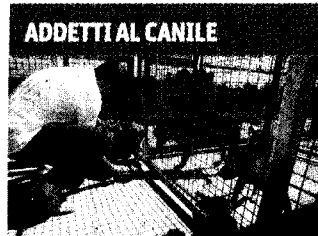
ADDETTI AL CANILE

È stato ritenuto legittimo un contratto di collaborazione coordinata e continuativa per lo svolgimento delle pratiche ed operazioni doganali e portuali nell'ambito delle spedizioni