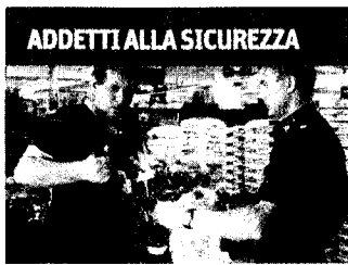
ADDETTI ALLA SICUREZZA