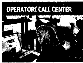
OPERATORI CALL CENTER

È la categoria in cui rientra il sorvegliante del centro commerciale